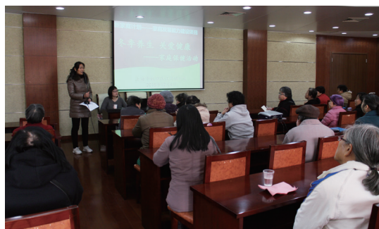
家庭的综合发展能力。

一步加强计划生育特别扶助对象医疗服务工作的通知》要求及推进工作进行了解读。他指出，上海的“新家庭计划-家庭发展能力建设”工作要在新时期借助卫生计生系统资源整合优化的新契机，通过宣传倡导、科学培训、深入基层、进入家庭的项目途径，紧紧围绕“家庭保健”、“科学育儿”、“养老照护”、“文化建设”四个方面开展内容丰富、形式多样的培训活动，从点滴入手，从基层抓起，促进家庭成员的身心健康与文明素质，提高家庭特别是计划生育